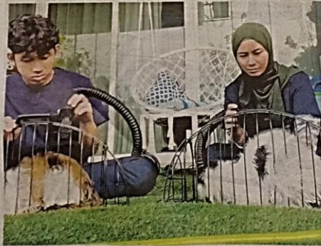
DISEBABKAN cinta dan minat yang mendalam terhadap kucing, mereka sedia melakukan pelbagai khidmat berkaitan haiwan tersebut.

2018 itu sebagai kerjaya sepenuh masa," ujarnya yang turut dibantu dua staf.