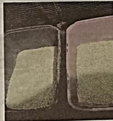
PENGUNAAN pasir memudahkan kerja-kerja pembersihan.

Sehingga kini, tempahan paling jauh yang pernah diterimanya adalah dari Banting, Selangor.