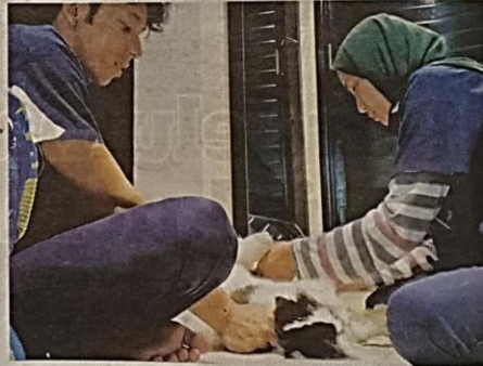
SELAIN melakukan pembersihan sangkar dan najis kucing, Amani Cats World turut menyediakan khidmat dandanan kucing.

"Suami menghidap sakit sendi tulang belakang dan baru-baru ini, dia kerap jatuh sakit secara tiba-tiba dan ia membuatkan saya menjadi bimbang. Jadi, kami berdua pun memutuskan untuk melakukan khidmat dandanan kucing yang sudah dimulakan sejak